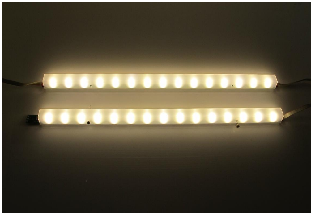
Abbildung zeigt 2-er Set für Montage auf einer Wand

Adventure, die Sets ( 2-er und 4er ) für die Rücklehnenbeleuchtung in warmweiß